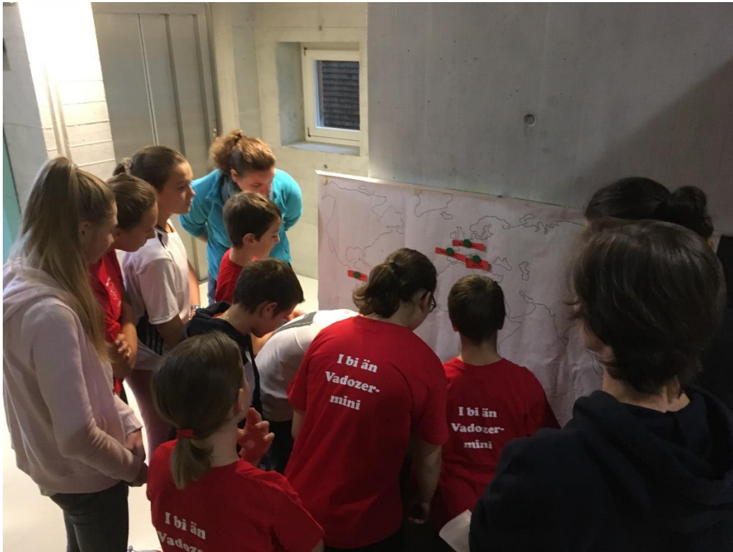
Die Vaduzer Minis bei einem Posten

Nach der Mittagpause war dann viel Geschicklichkeit gefragt ob mit verschiedenen Vehikel Runden und Parcours zu drehen oder zusammen beim Skilaufen.